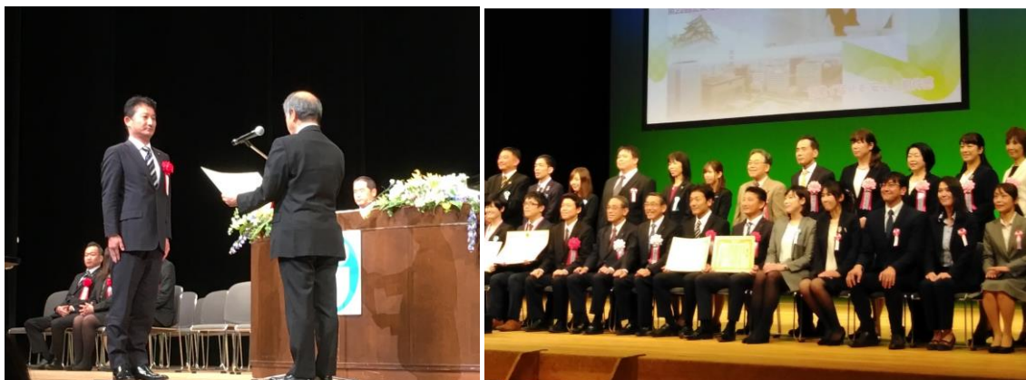
2018年11月22日に開催された表彰式の様子 (名古屋国際会議場にて)

ユーザ協会 HP 「企業電話対応コンテスト」 http://www.jtua.or.jp/education/contest/