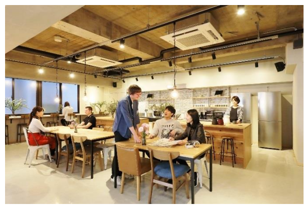
コモンキッチン&ダイニング