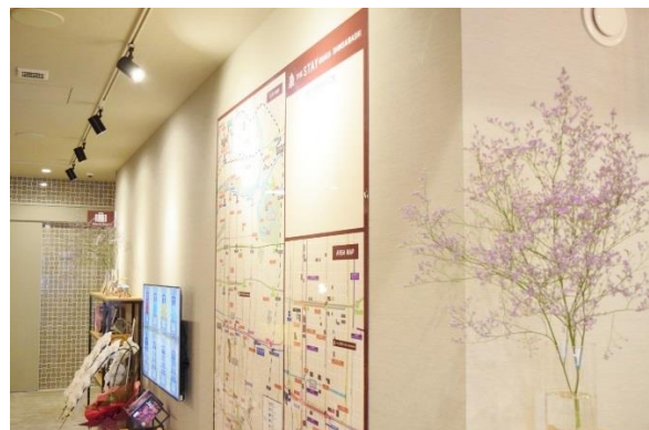
おすすめスポット マッピングボード

当ホステルの2階には、大阪経済大学の学生とコラボレーションし、ローカルフードが楽しめる飲食店や、大阪の住まいと暮らしの歴史を知る古民家のある場所など、学生ならではの視点・感性を活かした地域の見どころやおすすめのスポットをマッピングし公開します。また、行政との連携で地域の特産品のアピールの場としても活用する予定です。