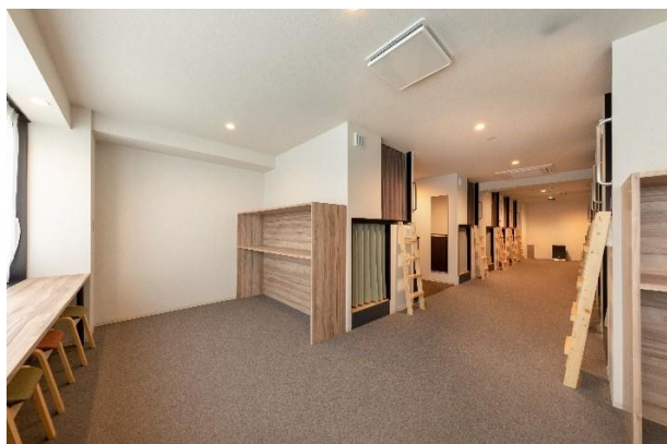
ドミトリールーム

3階から7階は客室フロアとしました。全室カードキーによるセキュリティーとし、大きな荷物やノートパソコンなどが置ける広めのドミトリールームや和室生活が体験できる5名個室など、12タイプの客室を設けました。