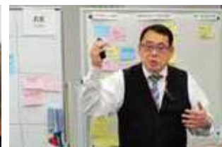
ゼミナールの様子