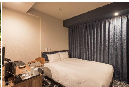
客室(ダブルルーム ※シングルユース)