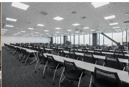
カンファレンスルーム