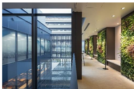
ラウンジ(休憩スペース)