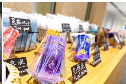
アメニティバイキング