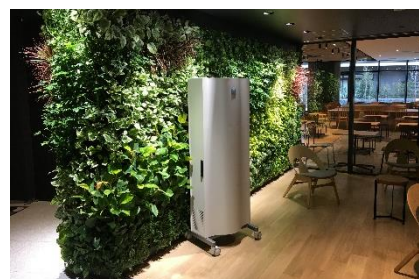
GENANO ® 5250A

※メーカーテスト結果として、ウイルス抑制(25 m 3 密閉空間において風量 40 m 3 /h で稼働し、416 分後 99%抑制) 菌抑制(25 m 3 密閉空間において風量 40 m 3 /h で稼働し、388 分後 99%抑制)の効果検証。