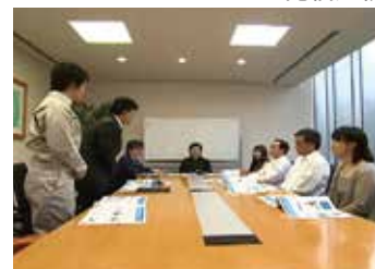
面接・ヒアリング

実際の施工会社のプレゼンテーションを受け、説明選考会を模擬体験し、施工会社選定のポイントを学びます。設計監理会社が行う選定補助業務に沿って実施いたします。